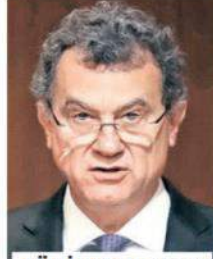
TÜSİAD Başkanı Simone Kaslowski

SEÇİMLER bittiği için 4.5 yıllık kesin-tisiz bir ekonomik reform dönemine girmeye hazırlanan iş dünyası, İstanbul seçiminin yenilenmesi kararıyla yeni bir şok yaşadı. İş dünyasının önde gelen örgütlerinden yapılan açıklamalarda, seçim ortamına yeniden dönmenin kaygı verici olduğu ifade edildi. Türk Sanayicileri ve İş İnsanları Derneği (TÜSİAD), Yüksek Seçim Kurulu'nun (YSK) İstanbul'da seçimlerin tekrarlanması kararına tepki gösterdi. TÜSİAD, Twitter'dan yaptığı açıklamada, "Kapsamlı bir ekonomik ve demokratik reform gündemine odaklanmamız gereken bu dönemde, seçim ortamına geri dönmek kaygı verici" sözlerine yer verdi. Türk Girişim ve İş Dünyası Konfederasyonu'ndan (TÜRKONFED) yapılan açıklamada da, İstanbul seçiminin sonuçlandırılmasında demokratik meşruiyet ve uluslararası demokratik standartlar açısından iyi bir sınav verilmediği vurgulandı. Açıklamada, "İhtiyacımız olan seçim değil, demokratik reformlarından güç alan, uluslararası itibarı