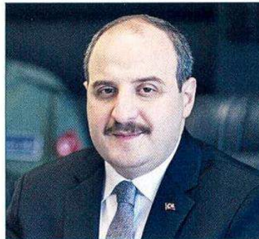
Sanayi ve Teknoloji Bakanı Mustafa Varank

Varank, sanayi üretiminin martta yüzde 2.1'lik artışla aylık bazdaki pozitif seyrini sürdürmeye devam ettiğini belirterek, "Pozitif seyre katkı sağlayan sermaye malları ve ara malı üretimindeki artışlar, reel sektörümüzün ekonomiye olan güvenini göstermesi açısından önemli" ifadelerini kullandı.