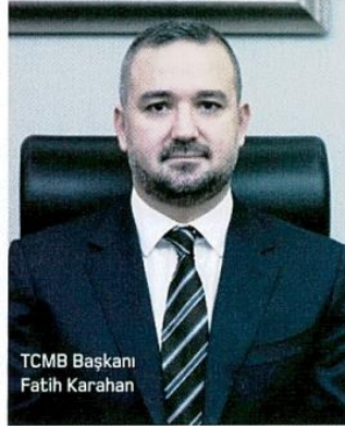
TCMB Başkanı Fatih Karahan

2024 yılı enflasyon tahmininin 2 puanlık artışında; çıktı açığı tahmini güncellemesinin 0.4 puan, enflasyon ana eğiliminin 1.8 puan, gıda fiyatlarının 0.2 puan artırıcı yönde etkisi oldu. Enflasyon tahminlerini Türk lirası cinsi ithalat fiyatları 0.2 puan, yönetilen yönlendirilen fiyatlar 0.2 puan aşağı çekti. TCMB Başkanı Fatih Karahan 2024 yılının ilk dört ayında 4 puana yakın ilave enflasyon geldiğini vurgulayarak,