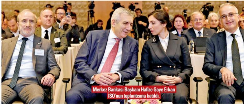
Merkez Bankası Başkanı Hafize Gaye Erkan ISO'nun toplantısına katıldı.

Erkan, TL mevduat güçlenirken ve kur korumalı ile döviz cinsi mevduatın gerilediğini, rezervlerin de çok güçlü bir artış eğiliminde olduğunu dile getirdi. Gerek parasal sıkılaştırma gerek sadeleştirme adımları sayesinde getiri eğrisinin normalleştiğini ve sabit getirili TL varlıklara olan iç ve dış ilginin önemli ölçüde arttığını bildiren Erkan, "TL'ye