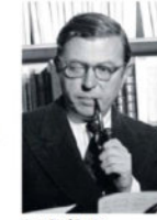
Jean Paul Sartre

Fransız felsefeci ve yazar Jean Paul Sartre yaşamını yitirdi. Beatles'in kurucularından John Lennon, New York'ta 8 Aralık'ta tabanca ile vurularak öldürüldü.