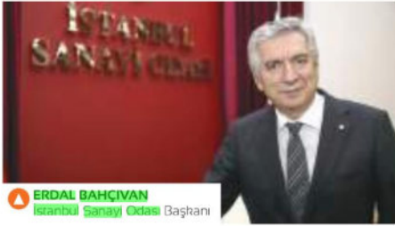
ERDAL BAHCIVAN İstanbul Sanayi Odası Başkanı