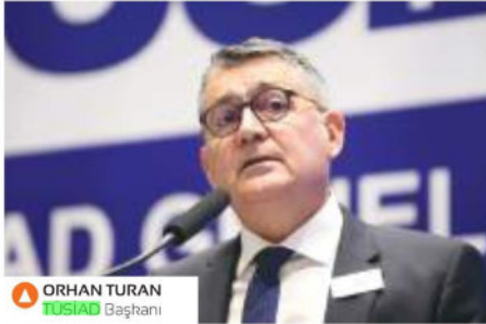
ORHAN TURAN TÜSİAD Başkanı

sabit giderler bizi endişelendiriyor. 2024'te organize perakendenin performansında kira ve personel giderleri başta olmak üzere maliyet artışlarının düzeyi, tüketicilerin alım gücü ve turist alışverişi belirleyici olacak" dedikten sonra şunları söyledi: "Organize perakendenin değişen trendlere, tüketicinin talep ve beklentilerine göre kendini hızla yenilemesi gerekiyor. Sektör bu konuda çok dinamik. Hatta çoğu zaman yenilikler konusunda tüketiciden daha hızlı refleks gösteriyor. Pandemiyle birlikte e-ticaretin payında çok hızlı bir artış oldu. E-ticaret altyapısına yatırım yine devam edecek. Diğer taraftan birçok markamız yeni dönemin beklentilerine uygun şekilde mağazalarında konsept değişikliğine gidiyor. Son yıllarda görmeye alıştığımız deneyim mağazalarının sayısı artıyor. Bütün bunların yanı sıra her marka kendi büyüme stratejisi çerçevesinde yeni mağaza açmak için fırsatları da değerlendirmek istiyor. Uygun kiralama koşullarının olduğu yerlerde yeni mağaza açılışlarının devam edeceğini düşünüyorum. Bu konuda öncelikle piyasadaki 'fiyatlar daha da artacak' beklentisini kırmak gerekiyor. Beklentinin kırılmasında ekonomi yönetimine önemli görevler düşüyor. Diğer taraftan organize perakende sektörü için kira en önemli maliyet kalemini oluşturuyor.