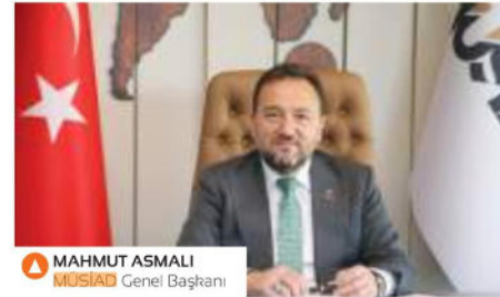
MAHMUT ASMALI MÜSİAD Genel Başkanı

Mahmut Asmalı , ekonomi yönetiminin sıkılaştırma politikalarına destek verdi. Alınan ekonomik tedbirler nedeniyle gelecek iki yıl 'oldukça sıkıntılı' olarak nitelendiren Asmalı, "Bu durum 85 milyonu ilgilendiren bir konu. O nedenle mücadelede her kesimin kararlı duruşu gerekiyor" dedi. Türkiye'de özellikle teknoloji, katma değerli üretim yapıp ihrac edenlere desteğin hiçbir zaman kesilmediğini söyleyen Asmalı, "Reeskont kredilerinde iki kat genişleme oldu. 1,5 milyar TL'den 3 milyar TL'ye çıkarıldı. İhracat ülkemizin cari açığını kapatmak için çok önemli. Destek noktasında bir sıkıntı yok" yorumunu yaptı. Asıl sıkıntının iç piyasada yaşandığını dile getiren Asmalı, inşaat, otomotiv başta olmak üzere bazı sektörlerde kredilerin hıslımasının daralma getirdiğini söyledi. "Ancak enflasyonu aşağı çekmek için bu kadar sıkılaşmaya da ihtiyaç vardı" diyen Asmalı'nın öngörüsüne göre, bu tedbirler karşısında zor