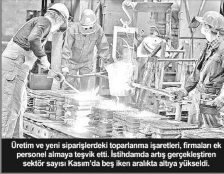
Üretim ve yeni siparişlerdeki toparlanma işaretleri, firmaları ek personel almaya teşvik etti. İstihdamda artış gerçekleştiren sektör sayısı Kasım'da beş iken aralıkta altıya yükseldi.

rında da artış bir önceki anket dönemi ile aynı hızda gerçekleşti ve enflasyon yılın ilk dönemlerine göre çok daha düşük oranda kaydedildi. Yine kasım ayında olduğu gibi tedarikçilerin teslim süreleri yılın son ayında da anket tarihinin rekoruna yakın bir iyileşme sergiledi. Anket katılımcılarına göre bu durum, zayıf girdi talebinin yanı sıra limanlardaki aksamların azalmasından kaynaklandı. Son