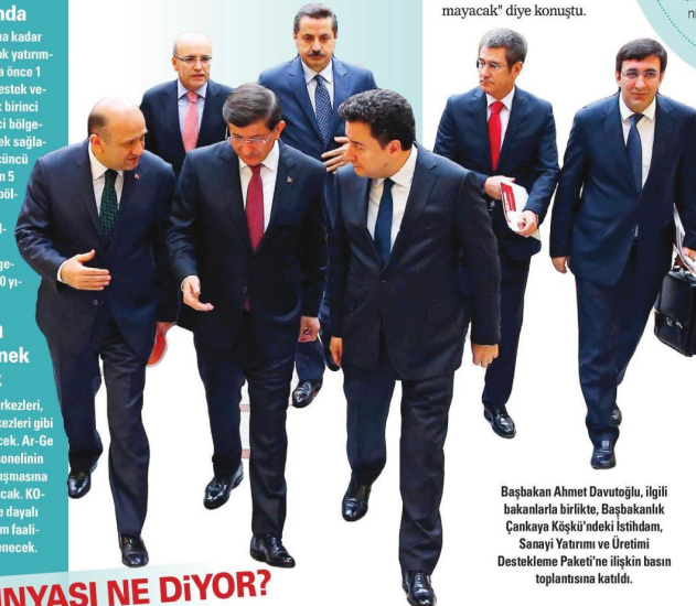
Başbakan Ahmet Davutoğlu, ilgili bakanlarla birlikte, Başbakanlık Çankaya Köşkü'ndeki İstihdam, Sanayi Yatırımı ve Üretimi Destekleme Paketi'ne ilişkin basın toplantısına katıldı.