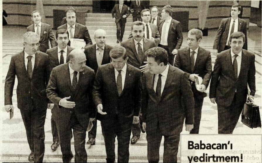
Toplantıda Başbakan Ahmet Davutoğlu'na, Başbakan Yardımcısı Ali Babacan, Bilim, Sanayi ve Teknoloji Bakanı Fikri Işık, Çalışma ve Sosyal Güvenlik Bakanı Faruk Çelik, Ekonomi Bakanı Nihat Zeybekci, Gümrük ve Ticaret Bakanı Nurettin Canikli, Kalkınma Bakanı Cevdet Yılmaz ve Maliye Bakanı Mehmet Şimşek eşlik etti.

Türkiye Kalkınma Bankası'nın yeniden yapılandırılacak.