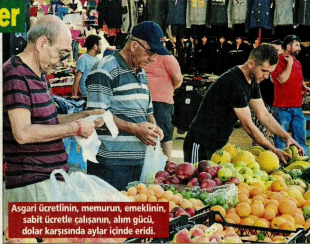
Asgari ücretlinin, memurun, emeklinin, sabit ücretle çalışanın, alım gücü, dolar karşısında aylar içinde eridi.