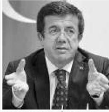
Ekonomi Bakanı Nihat Zeybekci

TÜRKİYE'NİN 13 yıllık büyüme ortalamalarının yüzde 4,7 olduğu bilgisini veren Ekonomi Bakanı Nihat Zeybekci, "2008 krizinden sonra bugüne kadar 24 çeyrekte ortalama büyümemiz yüzde 5,1. Ben bakan olduğumda yüzde 5,6 idi, şimdi 5,1'e geldi. Böyle devam ederse, bu 5 rakamında da ortalamayı aşağı çekersek, bunu bence tehlike çanları olarak görmemiz lâzım" ifadelerini kullandı. Istanbul Sanayi Odası'nın (İSO) Meslek Komiteleri Ortak Toplantısı'nda konuşan Bakan Zeybekci, "Bugün ikinci çeyrek büyümemiz yüzde 3,8 civarında çıktı. Üçüncü çeyrek büyümemiz bunun biraz daha altında olabilir ama dördüncü çeyrek büyümemiz çok daha yüksek olacak" dedi.