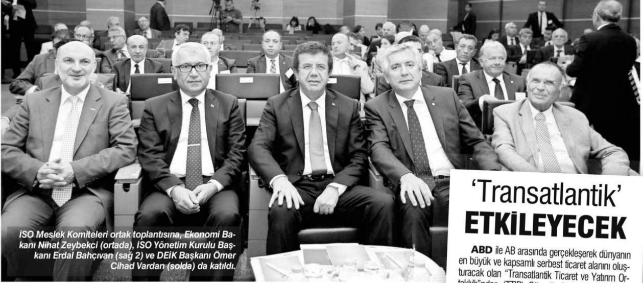
ISO Meslek Komiteleri ortak toplantısına, Ekonomi Bakanı Nihat Zeybekci (ortada), ISO Yönetim Kurulu Başkanı Erdal Bahçivan (sağ 2) ve DEİK Başkanı Omer Cihad Vardan (solda) da katıldı.