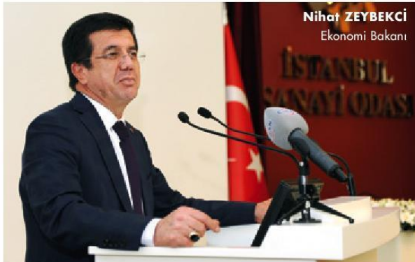
Nihat ZEYBEKÇİ Ekonomi Bakanı

Kalkınma Bankası'nın da yeniden yapılandırılması gerektiğini belirten Bakan Zeybekci, Türkiye'nin sürdürülebilir şekilde, cari açığını kabul edilebilir seviyede tutarak da büyüebileceğini söyledi. Ülkenin böyle bir potansiyeli olduğunu ifade eden Zeybekci, yakında Türkiye'nin çok daha farklı şekilde bazı finans imkânlarına ve kaynaklarına da kavuşabileceğini söyledi. Dünyanın son çeyreğinde büyüme motorunun Çin ve Hindistan gibi ülkeler olduğuna dikkati çeken Zeybekci, "Yeni dünyanın yeni büyüme motoru Afrika olacaktır. Sanayicilerin Afrika'ya karşı son derece duyarlı olmalarını öneriyorum" diye konuştu.