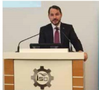
Berat Albayrak Enerji ve Tabii Kaynaklar Bakanı

Albayrak, toplumda enerji alanında verimlilik ve tasarruf bilinçlenmesinin ön ayağının üreticiler ve sanayiciler olduğunu vurgulayarak, sanayicilerin küresel