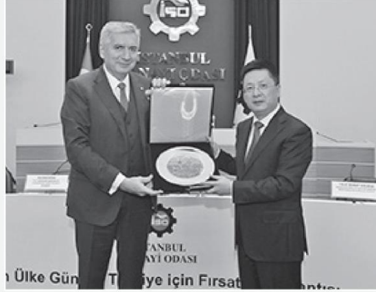
Çin Halk Cumhuriyeti İstanbul Başkonsolosu Bo Qian: "Çin beş yılda 8 trilyon dolardan fazla mal ithal edecek. Dış yatırımları da 750 milyar doları aşacak. Bu durum pek çok ülkenin yanında Türkiye ile aramızda büyük bir potansiyel yaratacak. Bu tren kaçarsa, 20-30 yıl kaybederiz."

Çin'in küresel çapta 100 milyar doların üzerindeki doğrudan yabancı yatırımlarından Türkiye'nin yetersiz pay aldığını da vurgulayan Bahçivan "Karşılıklı yatırımların yanı sıra, Çin ile Türkiye'nin Afrika ve Ortadoğu ülkeleri başta olmak üzere üçüncü ülkelerde ortak yatırımlar yapması için