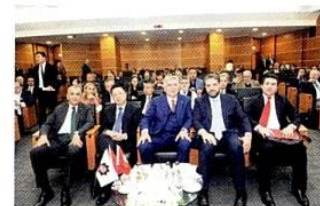
Toplantıyı izleyen ISO üyeleri, konuşmacıları soru yağmuruna tuttu.