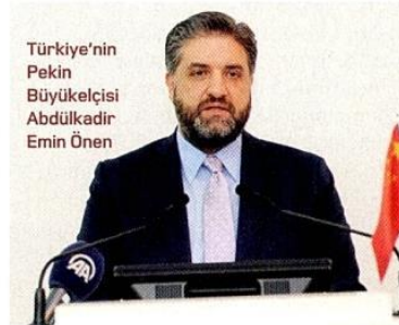
Türkiye'nin Pekin Büyükelçisi Abdülkadir Emin Önen

"Türkiye'nin Çinli turist pazarından pay alması için THY'nin Çin'de daha fazla noktaya uçuş gerçekleştirmesi gerekiyor. 1 milyon Çinli turist hedefliyoruz ancak mevcut uçakların hepsini Çinli turistlerle doldursak bile, yolcu sayısı 350 bini geçmez. Çin'den daha fazla frekans alıp daha fazla yerlere uçmalıyız. Gelenler İngilizce değil Çince konuşan turist rehberleriyle muhatap olmalı. Çinli turistlere yönelik çalışmalar yapıp, geldiklerinde rahat edecekleri bir ortam sunmalıyız. Dünyanın büyük şehirlerinin birçoğunda Çinlilerin ra-