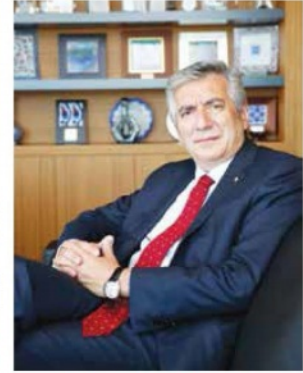
ISO Başkanı Erdal Bahçivan