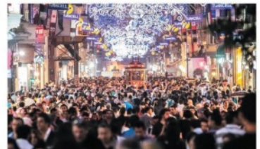
4. çeyrek büyümesinin de piyasayı tatmin etmesi bekleniyor.

çekleştireceğiz. 2017 genelinde baktığımızda da büyümenin yüzde 7'nin üzerinde olma ihtimali var. Gıda Tarım ve Hayvancılık Bakanı Ahmet Eymen Fakıbaba: Tanımsal gayrisafi hasılamız ilk 9 aylık dönemden yüzde 14 artarak 137 milyar TL olarak gerçekleşti. Son 14 yılın 12'sinde büyüme gösteren tarım sektörü sürdürülebilir büyüme ve gelişme sürecine devam ediyor. Sektörün son 14 yıldaki büyüme trendinde, özellikle tanımsal alt yapıların güçlendirilmesine yönelik yatırımlar, üretim kapasitesi ve teknoloji kullanımdaki gelişmeler etkili olduğunu görüyoruz.