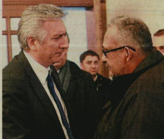
Ibrahim Çağlar'ın yakınları Üsküdar'daki İlmî Araştırmalar Merkezi'nde taziyeleri kabul etti.

1960 yılında İstanbul'da doğan Ibrahim Çağlar, İTO'da 1999 yılında Meclis üyeliği ile göreve başladı. 2004-2009'da İTO Yönetim Kurulu Başkan Yardımcılığı, 2009-2013'te İTO Meclis Başkanlığı yapan Çağlar, 2013 yılından beri İTO Başkanlığı görevini yürütmekteydi. Aynı zamanda Türkiye Odalar ve Borsalar Birliği Başkan Yardımcısı da olan Çağlar, evli ve 2 çocuk babasıydı.