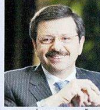
Rifat HİSARCIKLIOĞLU / Türkiye Odalar ve Borsalar Birliği (TOBB) Başkanı

Türkiye son yıllarda çalkantılı süreçlerden alnının aklıyla çıktı. Zira Türkiye'nin temelleri sağlam. Bu süreci de birlikte çalışarak geride bırakacağımıza inanıyoruz. Reel sektörün ve özellikle de KOBİ'lerin finansmana ulaşım imkanının açık tutulması bizler için hayati önemde. Son dönemde ekonomimizde olumlu gelişmeler var. Ancak ekonomideki canlanma istediğimiz noktada değil. Bu konuda oda ve borsalarımızdan gelen bizim de TOBB olarak hükümetimize ilettiğimiz dört sektördeki vergi indirimi hayata geçti. Sonrasında da