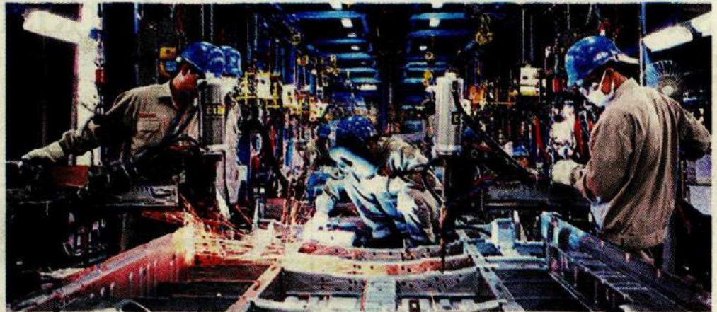
Representatives of the leading business organizations emphasize the significance to capitalize on a long no-election period after the March 31 municipal elections to swiftly implement the reforms the investment environment begs for.

After the municipal elections on Sunday, the Turkish public will not go to the ballot box for another four-and-a-half years. This period of opportunity, representatives from the business world advise, should be seized in the best way possible with reforms to fuel Turkey's growth again