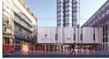
2. Ödül Mimarlar Burcu Sevinç, Rifat Yılmaz, Süleyman Yıldız