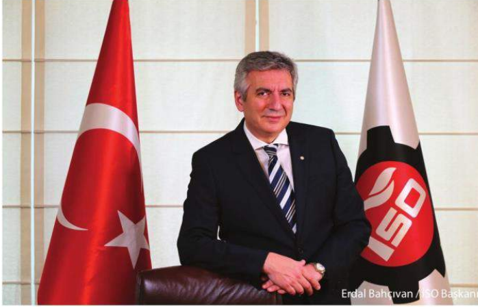
Erdal Bahçivan / İSO Başkanı

İstanbul Sanayi Odası Yönetim Kurulu Başkanı Sn. Erdal Bahçivan : "İSO 500 araştırmaları, ait oldukları dönemlerin adeta check-up'ını ortaya koyduğu için çok değerli. Çünkü İSO 500, öncelikle sanayimiz olmak üzere, ekonomimizin büyümesinden yatırım iklimine, ihracatından finansmana kadar birçok alanından bilgiler içeriyor. Başta siz değerli basın mensupları olmak üzere, ekonomi kamuoyunun bu bilgileri büyük bir merakla beklemesinin nedeni de bu.