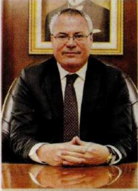
AHMET DENİZ Manisa Valisi

M anisa ekonomisine baktığımızda sanayiye doymuş olan merkezlere yakın olduğunu görüyoruz. İlimiz ayrıca gelişmiş ulaşım altyapısı ile yatırımcıları cezbeden avantajlı bir konuma sahip. 2018 yılı TÜİK verilerine göre nüfusu 1 milyon 429 bin 643 olan Manisa'da 2017 yılı itibarıyla kişi başına düşen gayrisafi yurt içi hasıla (GSYH) 9 bin 694 dolar ve bu rakam ile ülke genelinde 17'nci sırada yer alıyor.