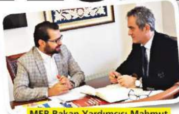
MEB Bakan Yardımcısı Mahmut Özer, mesleki ve teknik eğitimdeki başarının sırlarını Ankara Temsilcimiz Hacı Yakışıklı'ya anlattı.

LGS'de sonuçlarına göre Mesleki ve Teknik liselere rağbetin arttığını belirten Milli Eğitim Bakanı Yardımcısı Mahmut Özer , "Attığımız adımların meyvelerini kısa sürede vermesi bizleri mutlu etti ve sorumluluklarımızı artırdı" şeklinde konuştu.