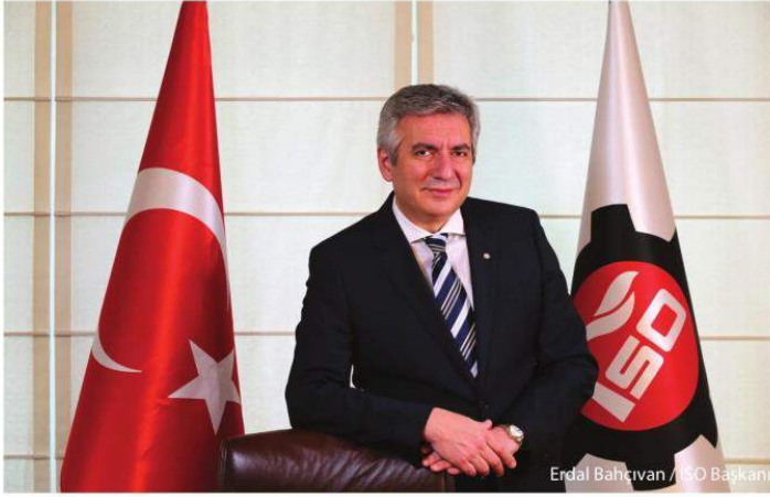
Erdal Bahçivan / ISO Başkanı

I stanbul Sanayi Odası Yönetim Kurulu Başkanı Sn. Erdal Bahçivan : "ISO 500 araştırmaları, ait oldukları dönemlerin adeta check-up'ını ortaya koyduğu için çok değerli. Çünkü ISO 500, öncelikle sanayimiz olmak üzere, ekonomimizin büyümesinden yatırım iklimine, ihracatından finansmana kadar birçok alanından bilgiler içeriyor. Başta siz değerli basın mensupları olmak üzere, ekonomi kamuoyunun bu bilgileri büyük bir merakla beklemesinin nedeni de bu.