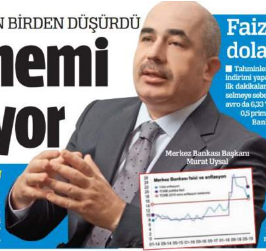
Merkez Bankası Başkanı Murat Uysal

merkez bankalarının da faiz düşürerek genişleyici para politikası adımları atılma ihtimalinin arttığı belirtilen açıklamada "Enflasyon görünümündeki iyileşme devam ediyor. Yılı ikinci çeyreğinde enflasyonun işlenmiş gıda ve enerji fiyatlarındaki yavaşlamanın katkısıyla belirgin düşüş sergilediği belirtilen açıklamada, sene sonu enflasyonunun, nisan ayında yayınlanan tahminin de altında kalacağına dair beklentinin güçlendiği dile getirildi. Para politikasında temkinli duruşun devam edeceği ifade edilen açıklamada ayrıca parasal sıkılaşın seviyesinin, enflasyondaki düşüşün sürekliliğini sağlayacak şekilde belirleneceği dile getirildi.