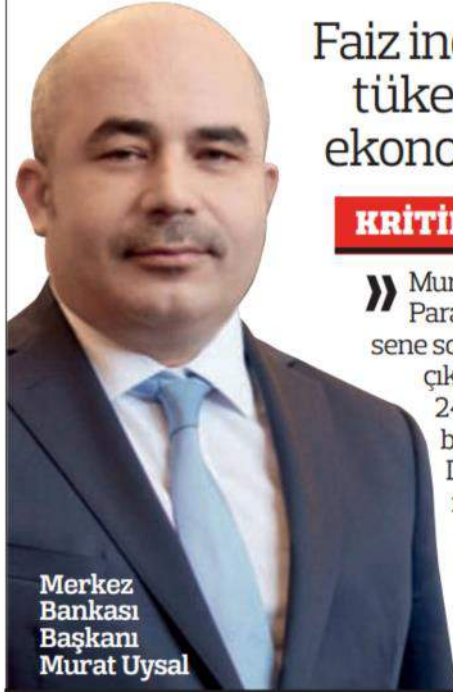
Merkez Bankası Başkanı Murat Uysal

Faiz indirimi üretim ve tüketimi canlandırıp ekonomiyi büyütecek