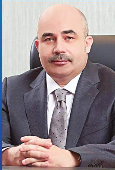
Merkez Bankası Başkanı Murat Uysal, faizi indirerek cesur bir karara imza attı.