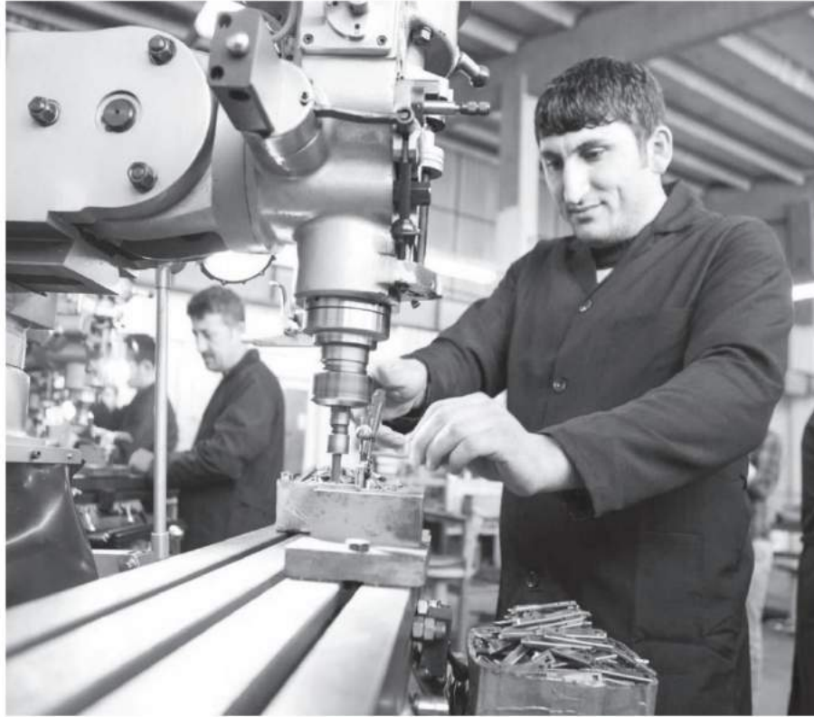
Sektörün yeni siparişlerindeki daralmanın hızı iç talepteki gerileme nedeniyle arttı.

PMI verileri, Türk imalat sektöründeki faaliyet koşullarının temmuzda zorlu kalmaya devam ettiğine işaret etti. Sektördeki daralma 16'ncı ayda da sürdü. İhracat siparişlerinin istikrarlı seyrine bağlı olarak üretimdeki yavaşlama hızı son 4 ayın en düşük düzeyinde gerçekleşti.