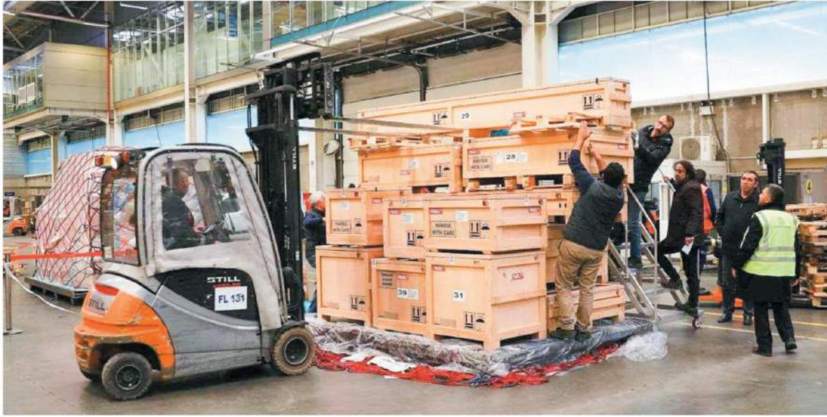
Ağustos ayının lideri, ihracatını yüzde 8,4 artırarak 1.74 milyar dolara ulaşan otomotiv sektörü oldu. Yüzde 19 artışla 1.63 milyar dolara ulaşan kimyevi maddeler sektörü ikinci, yüzde 1,2 artışla 1.4 milyar dolara ulaşan hazır giyim ve konfeksiyon üçüncüleri oturdu.