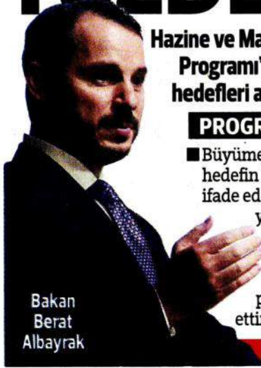
Bakan Berat Albayrak

■ Albayrak enflasyon hedefiyle ilgili de şunları söyledi: "2019'u yüzde 12'lik enflasyon tahminiyle geride bırakmayı hedefliyoruz. 2020 için yüzde 9.8 hedefi yüzde 8.5 olarak revize ettik. 2021'de yüzde 6, 2022'de de yüzde 4.9'luk enflasyon hedefliyoruz". »7'de