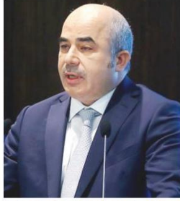
Türkiye Cumhuriyet Merkez Bankası Başkanı Murat Uysal, İstanbul Sanayi Odasında ekonomik gündemi değerlendirdi.