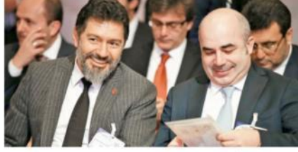
Merkez Bankası Başkanı Murat Uysal ile Borsa İstanbul Genel Müdürü Hakan Atilla, İSO'nun meclis toplantısına katıldı.