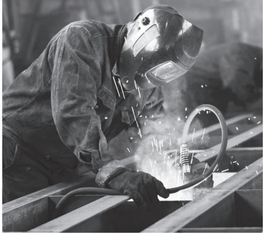
Kurdaki artan maliyetler sanayicinin hesaplarını değiştirdi.

İmalat PMI (Satın Alma Yöneticileri Endeksi) anketinin Ekim 2021 dönemi sonuçları açıklandı. Buna göre, manşet PMI, üst üste beş aydır eşik değer olan 50,0'nin üzerinde gerçekleşmesine karşın bir önceki aya göre geriledi ve 51,2 oldu. Endeks Eylül ayında 52,5 düzeyinde bulunuyordu. Sektördeki yavaşlama belirtileri özellikle üretim ve yeni siparişlere ilişkin verilerde ön plana çıktı. Her iki gösterge de yılın son çeyreğinin başlangıcında hız kaybetti. ISO'dan yapılan açıklamaya göre, girdi temininde yaşanan zorluklar ve döviz kurlarındaki olumsuz dalgalanmalar aktiviteyi sınırladı ve üretim hacmi son beş ayda ilk kez azaldı. Söz konusu gelişmeler yeni siparişlerin de ılımlı düzeyde olmakla birlikte yavaşlamasına yol açtı. Firmalar yeni siparişleri kısıtlayan etmenler arasında özellikle elektronik parça tedarikindeki yetersizliklere işaret etti. Diğer yandan, toplam yeni siparişlerdeki görünümün aksine yeni ihracat siparişlerinde artış güçlü şekilde devam etti. Ekim ayında tedarik zincirlerindeki gecikmeler sektör içerisinde yaygın olarak devam etti ve teslimat süreleri Eylül ayına kıyasla daha yüksek oranda arttı. Girdi maliyetleri keskin bir şekilde arttı ve bu artış son üç ayın en yüksek oranında kaydedildi. Türk lirasındaki değer kaybı da girdi fiyatlarındaki yükselişin temel sebeplerinden biri oldu. Bunun