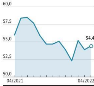
İSO İhracat İklimi Endeksi

zandı. Buna karşılık Almanya'da üretim artış hızı yeniden 2022'de görülen en düşük seviyeye geriledi. Türk imalatçıların diğer iki ana ihracat pazarı olan ABD ve Birleşik Krallık'ta ise büyüme hızı kaybetmesine rağmen yüksek temposunu korudu. Birleşik Arap Emirlikleri'nde petrol dışı ekonomik aktivite nisan ayında güçlü bir şekilde artmaya devam etti ve büyüme yılbaşından bu yana en yüksek hıza ulaştı.