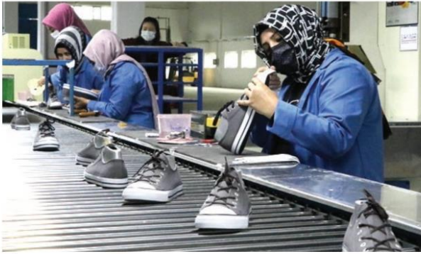
İmalat PMI, kasımda 45.7'ye gerileyerek daralmanın devam ettiğini ortaya koydu. Endeks koronavirüs salgının hastalığının başlangıcı olan 2020'nin başından bu yana en düşük seviyede.