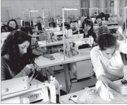
Takip edilen 10 sektörün sadece ikisinde (giyim, kara-deniz taşıtı) üretim arttı.