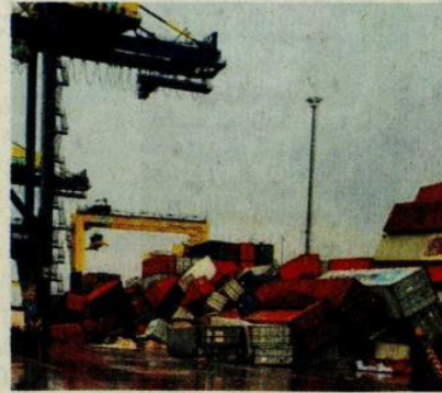
10 ili vuran deprem felaketi büyük can ve mal kaybına yol açtı.

■ Türk Girişim ve İş Dünyası Konfederasyonu (TÜRKONFED) Yönetim Kurulu Başkanı Süleyman Sönmez: “Depremden etkilenen 10