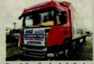
Bircok il ve ilçeden belediyeler yardım TIR'ları yolladı.

DEPREM mağdurlarının barınma ihtiyacının karşılanması için yeni bir platform kuruldu. Hepsismlak tarafından kurulan 'Dostluk Çatısı' platformu ile konaklamaya müsait bir evi ya da odası olanlarla, yer arayanlar buluşturuluyor. Hepsismlak.com üzerinden 'Konaklamaya uygun yerim var' ya da 'konaklama ihtiyacım var' formları doldurularak taraflar bir araya geliyor.