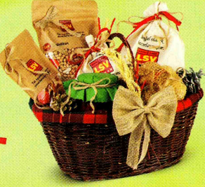
HAYAT BAĞI SEPETİ

Antakya'lı Depremzede Annelerimizin Elinden Biberli Ekmek