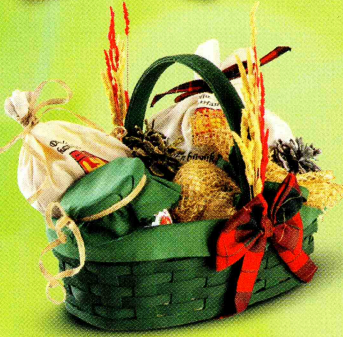
LÖSEV İYİLİK SEPETİ

DOĞAL ÜRÜNLER İÇİN QR KODU OKUTABİLİRSİNİZ