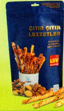
LSV Kaşarlı Çubuk Kraker