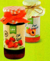
LSV Anne Mutfağımızın Reçelleri

*Kişisel - kurumsal siparişleriniz ve bağışlarınız için: 0312 436 34 00