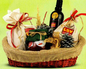
CAN SUYU SEPETİ