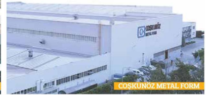
COSKUNOZ METAL FORM