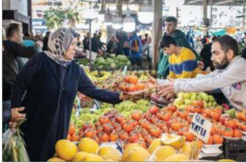
Gıda üretimindeki küçülmenin vatandaşın yiyecek alamayacak duruma gelmesi ni gösterdiği belirtildi.