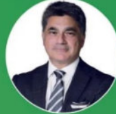
Murat Tarakçıoğlu Cargill Orta Doğu, Türkiye ve Afrika Yönetim Kurulu Başkanı ve CEO'su