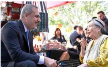
Hakan Fidan @HakanFidan

Uzun yıllardır, Türk İslam medeniyetinin kuruluşuna katkı veren pek çok tarihi şehri ziyaret etme fırsatı oldu.