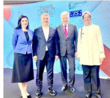
Arnavutluk / Tiran

Avrupa Konseyi Parlamenter Meclisi Türk Delegasyonu Üyeleri olarak 'Eşitlik ve Ayrımcılığın Önlenmesi Komisyonu' Toplantısında güncel konuları ele alma ve görüşmeler yapma imkanı bulduk. #AKPM_TR