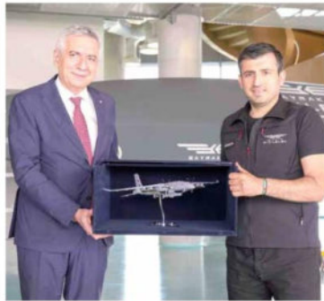
İstanbul Sanayi Odası Yönetim Kurulu,