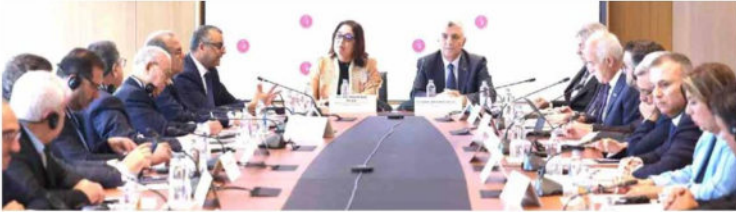
Prof. Dr. Ömer Bolat @omerbolatTR

Tunus Cumhuriyeti Ticaret ve İhracatı Geliştirme Bakanı Sayın Kalthoum Ben Rejeb Ep. Guezzah ve her iki ülkeden kayımetli iş insanlarının katılımıyla Türkiye-Tunus Yuvarlak Masa Toplantımızı gerçekleştirdik.