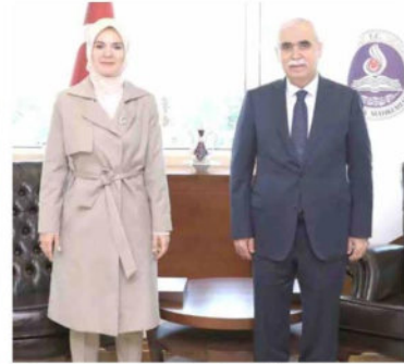
Mahinur Özdemir Göktaş @MahinurOzdemir

Anayasa Mahkemesi Başkanı Sayın Kadir Özkaya'ya yeni görevi vesilesiyle hayırlı olsun ziyaretinde bulunduk.