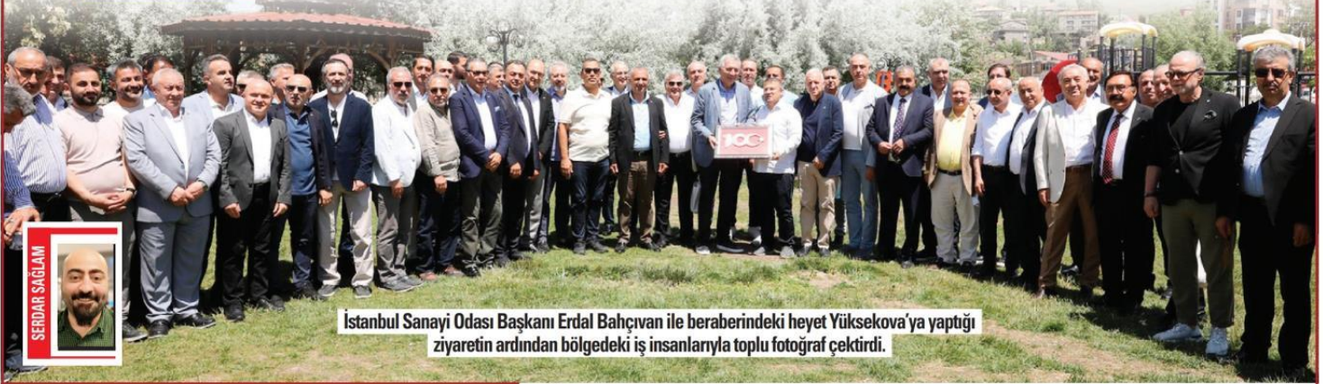
İstanbul Sanayi Odası Başkanı Erdal Bahçivan ile beraberindeki heyet Yüksekova'ya yaptığı ziyaretin ardından bölgedeki iş insanlarıyla toplu fotoğraf çekti.

İstanbullu sanayiciler , Cizre, Şırnak, Hakkari ve Yüksekova'da yatırım ve işbirliği için tura çıktı. Sanayicilerin hedefinde ise konfeksiyon ve hazır giyim gibi emek yoğun sektörler var.