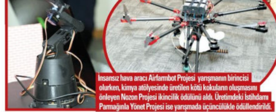
İnsansız hava aracı Airfarmbot Projesi yarışmanın birincisi olurken, kimya atölyesinde üretilen kötü kokuların oluşmasını önleyen Nozon Projesi ikincilik ödülünü aldı. Üretimdeki İstihdamı Parmağınla Yönet Projesi ise yarışmada üçüncülükle ödüllendirildi.

büyüme aşamaları, mahsulün sağlığı ve toprak varyasyonları hakkında gerçek zamanlı bilgi edinilmesi sağlanıyor. Aynı zamanda sahip olduğu sıvı tankı sayesinde, zirai ilaçlama işlemlerini daha verimli ve insan sağlığına zarar vermeden uygulayabiliyor.