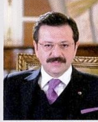
Rifat HİSARCILIOĞLU / Türkiye Odalar ve Borsalar Birliği (TOBB) Başkanı

Cumhuriyetin ilanının 100. yıldönümü olan 2023'ü, gururla ve coşkuyla ama aynı zamanda buruk bir şekilde geri bırakıyoruz. Senenin başında asrın felaketi olan nitelendirilen deprem kâbusunu 11 ilimizde yaşadık. Senenin sonunda İsrail'in Gazze'de gerçekleştirdiği vicdansız ve acımasız saldırının dehşetiyle sarsıldık. Ekonomideyse enerji ile gıdadaki arz ve tedarik sorunları, yüksek enflasyon, jeopolitik gerilimler ve savaşların olumsuz yansımalarıyla karşılaştık. Yaşanan tüm zorluklara rağmen 2023 yılında ekonomide beş alanda rekor kırdık. Üretim hacminde (GSYİH) ilk