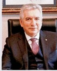
Erdal BAHCIVAN / İstanbul Sanayi Odası (ISO) Başkanı

2023, ülkemiz için tarihte örneği olmayan bir deprem felaketiyle başladı. Çok büyük bir travmaydı. Sadece ekonomik yönden değil, psikolojik, sosyolojik ve toplumsal açıdan dengeleri altüst etti. 2023'ün ilk altı ayını deprem ve seçim ikliminde geçirdik. İkinci altı aydan sonra kadrolarda yaşanan değişimle beraber istikrarın oluşacağına dair olan öz güven artmaya başladı. Yaşanan gelişmelerin ardından 2024 yılı, en kötünün artık geride kalmaya başlayacağı bir yıl olarak görülmeye başlandı. Ancak 2023'ün son günlerinde dünyada yaşanan durgunluğun etkileri